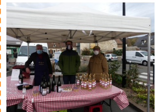
Marché du 15 novembre 2020