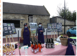
Marché du 18 octobre 2020