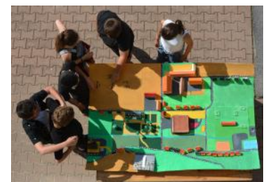
La maquette construite par le groupe des 11-17 ans.