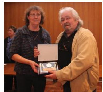
En mars 2015, lors de la soirée des mises à l'honneur.