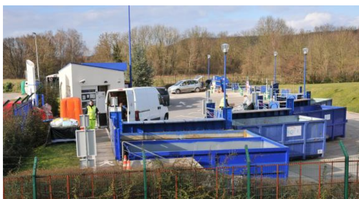
La déchetterie de Clairoix, inaugurée en 1983.