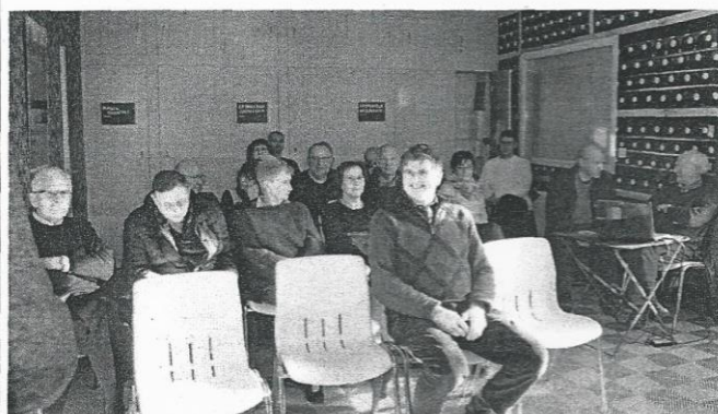
L'assemblée générale et les deux conférences organisées à Clairoix ont été suivies par une vingtaine de personnes.

Les membres de l'association Art, Histoire et Patrimoine de Clairoix se sont réunis dans la salle du chai samedi 10 février. Il s'agissait de leur traditionnelle assemblée générale visant notamment à préparer les activités pour l'année 2018.